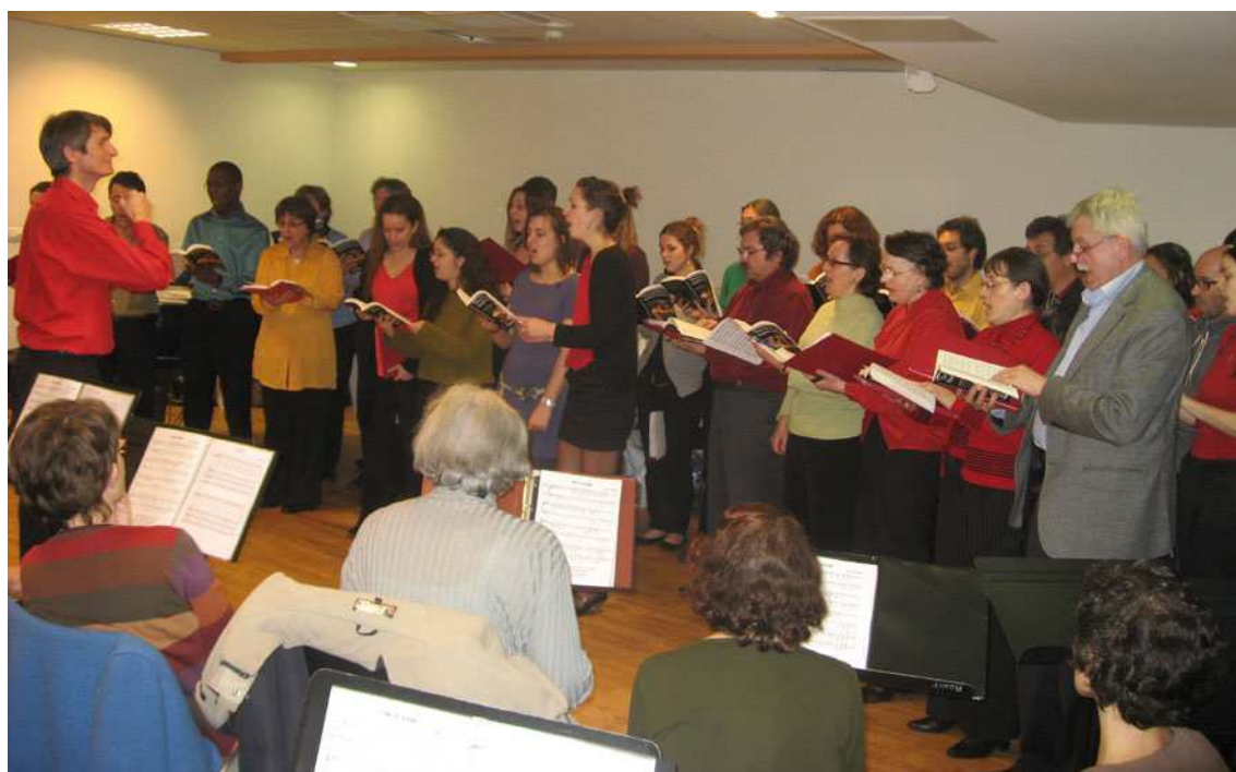
Le Madrigal chante devant les choristes de « Un chœur qui bat. »

Les délégués départementaux de France Parkinson ont annoncé leur présence.